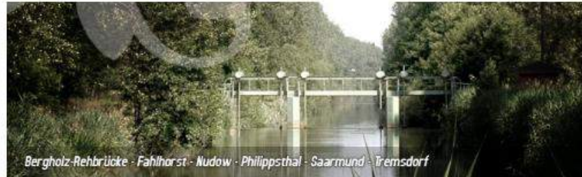
Bergholz-Rehbrücke - Fahlnhorst - Nudow - Philippsthal - Saarmund - Trensorf